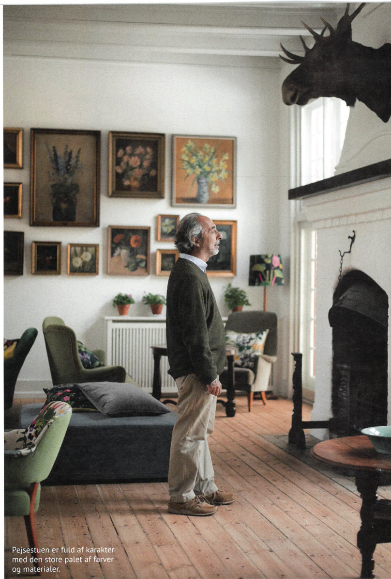
Pejsestuen er fuld af karakter med den store palet af farver og materialer.